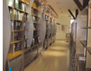
Centre de documentation du Forum.

Depuis avril 2000, le Forum des Marais Atlantiques est un syndicat mixte ouvert élargi. Cette forme juridique a fait suite à une phase de préfiguration (1998-1999) abritée au sein du Conservatoire du Littoral.