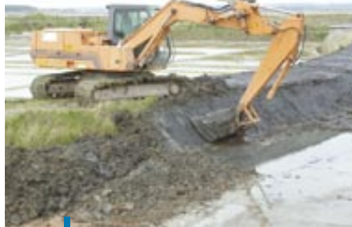
↳ Réfection de digue en marais salé salicole.

En Artois-Picardie , les canaux et watergangs de la plaine de l'Aa entre Dunkerque et Calais ont été classés en masses d'eau fortement modifiées ; le marais de Saint-Omer a quant à lui été identifié comme masse d'eau artificielle. Les autres zones humides ont été signalées sur une carte spécifique.