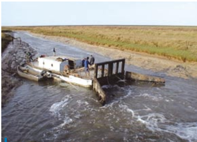
Draguage par bac à rateau (bacage).

Dans le cas où les marais littoraux peuvent être rattachés à une masse d'eau identifiée, il s'agit ensuite de mettre en avant les exigences d'entretien et de gestion qui concourent à leur bon état. D'ores et déjà, le cadrage des SAGE et les actions identifiées au sein des Contrats Restauration Zones Humides permettent d'identifier les maîtres d'ouvrage et les travaux nécessaires.