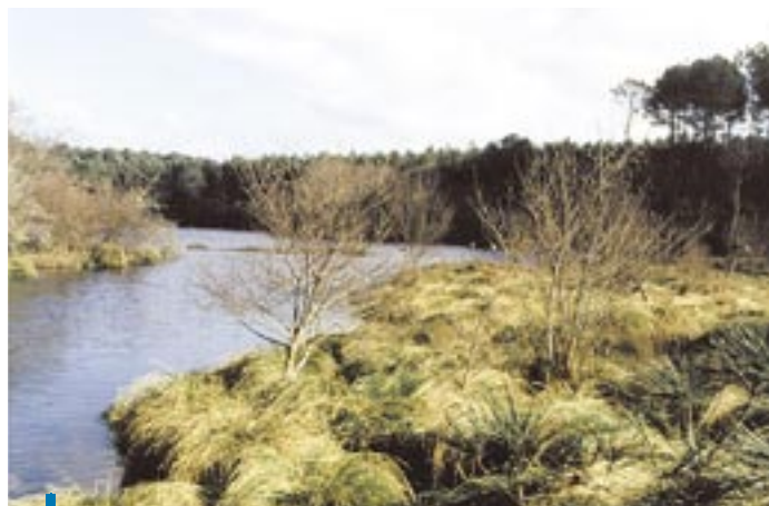
Marais ouvert, l'un des habitats de prédilection du Vison d'Europe. (Photo Pascal Fournier).