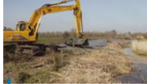
Ouvrage de fossé en marais doux.