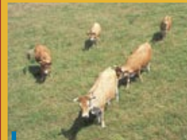
Maraîchines en pâture (Photo : Daniel Mar, collection PIMP).

La situation de la commune du Bourdet est similaire à celle d'autres communes du marais poitevin : la poursuite de la mise en culture de maïs non irrigués apparaît plus rentable et plus facile par rapport à une remise en herbe qui mobilise de manière forte éleveurs et structures publiques.