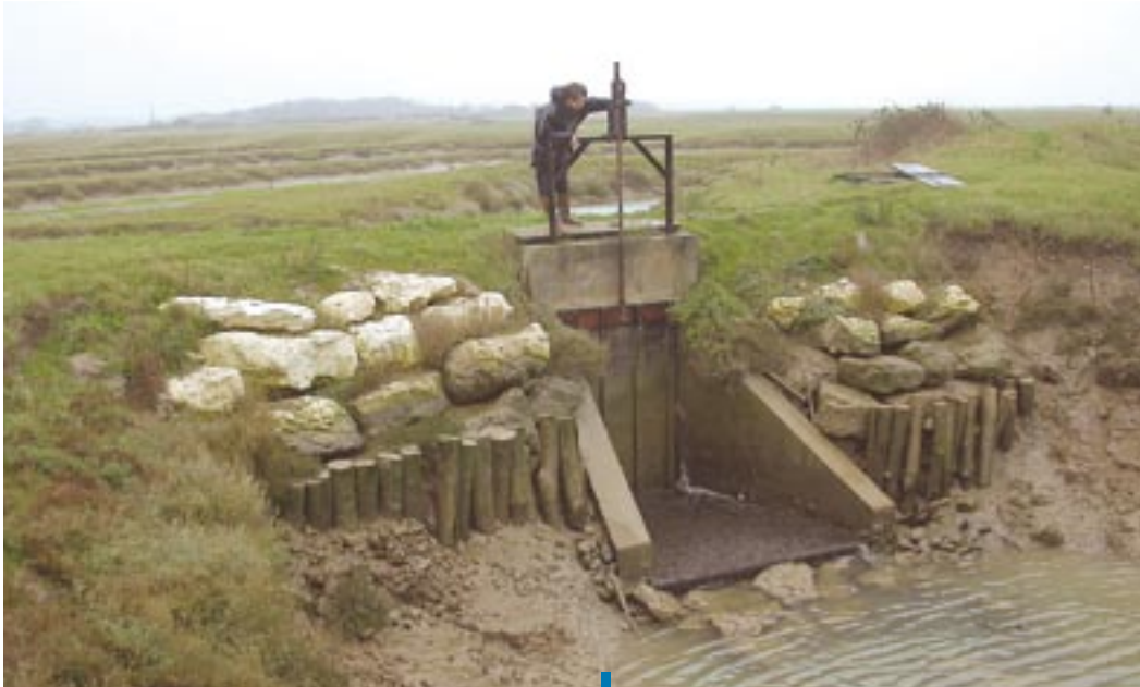
↳ Réfection d'un ouvrage hydraulique en marais salé.

En Adour-Garonne , ce sont essentiellement les commissions "Littoral" et "Charente" qui traitent des marais littoraux. Une carte des grands ensembles humides est proposée dans l'état des lieux. Certains canaux principaux de marais ont été identifiés comme masses d'eau artificielles : chenal du Gua, chenal de Brouage, canal de l'UNIMA, canal de la Seudre à la Charente. Les canaux situés entre les étangs landais de Carcans-Hourtins et Lacanau puis entre Lacanau et la Baie d'Arcachon ont également été classés dans cette catégorie. Les estuaires sont identifiés comme masses d'eau de transition.