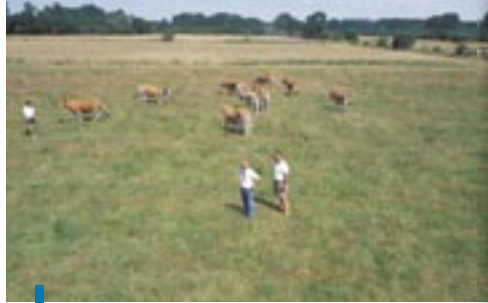
Entrée de maraîchines dans les communaux du Bourdet. (Photo : Daniel Mar, collection PIMP).