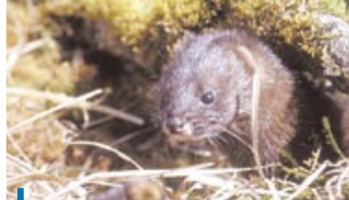
Vison d'Europe.

Cette synthèse de recommandations devrait être complétée courant 2005 par le recueil des communications des journées techniques. La réussite de ces journées constitue un véritable espoir pour l'espèce, prélude d'un nouveau plan qui devrait voir le jour fin 2005.